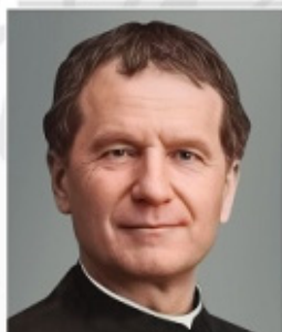
Don Bosco 1874 - 1888